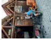
Pêcheur réparant des arts de pêche

Au terme de cette visite, tournez à droite, sur la