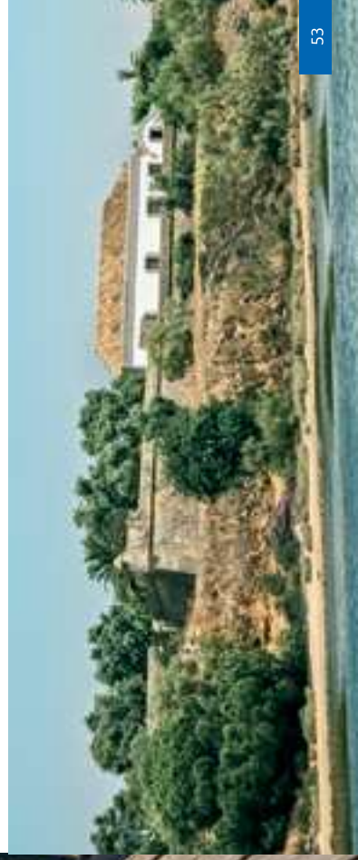
Forteresse de São João da Barra (en bas)