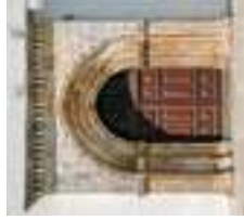
Portail de l'église Nossa Senhora da Conceição

À proximité de la route, admirez la magnifique 7 église Nossa Senhora da Conceição (Notre-Dame-de-la-Conception), du XVI ème siècle. S'y distingue la chapelle principale recouverte d'une voûte d'arête, dont la clef présente les armes de l'Ordre de Santiago (Saint Jacques). Sur la façade principale, s'ouvre un portail à la décoration de style gothique tardif manuélin et surmonté d'un fronton issu des interventions du XVIII ème siècle, qui lui confèrent des formes baroques.