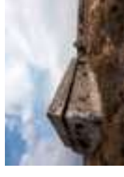
Fort do Rato

muséologique de la pêche au thon), qui décrit la capture du thon, la vie des pêcheurs et de leurs familles sur ce lieu. Au retour, par le même chemin, vous trouverez, à votre droite, le fort 44 Forte do Rato , érigé sous le règne du roi Sebastião 1 er de Portugal, en vue de protéger à la fois l'entrée du port et la ville de Tavira. Lorsque vous arriverez sur le dernier rond-point que vous avez contourné, prenez la direction du centre de Tavira (Mercado municipal – marché municipal), au rond-point suivant, suivez la direction du 15 Mercado Municipal et tournez immédiatement à gauche passez sur le pont Ponte dos Descobrimentos, où se trouve, du côté gauche, le Mercado Municipal, espace où il est possible d'acheter quelques produits locaux.