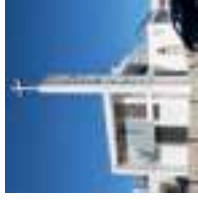
Église paroissiale de Santa Luzia

poissons et fruits de mer. Appréciez la vie de ce village de pêcheurs et les arts de la pêche qui cohabitent avec le tourisme et l'hospitalité de ses habitants. Savourez, dans l'un des restaurants, la gastronomie du poulpe typique. Santa Luzia, dont le territoire fait à peine 850 hectares, est la paroisse civile la plus petite de la commune de Tavira. Sur la place de l'église, admirez la moderne 6 église paroissiale de Santa Luzia , projet de l'architecte Manuel Gomes da Costa, originaire de l'Algarve, datant de 1956-58 et ayant remplacé la chapelle primitive du XVI ème siècle.