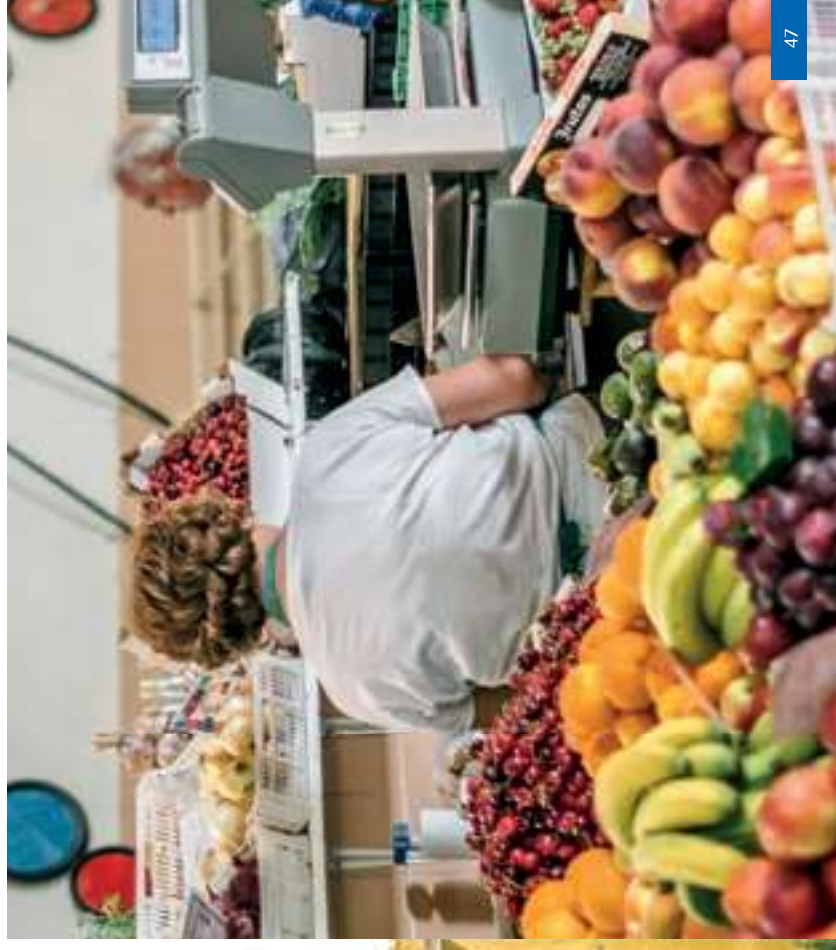
Mercado Municipal de Tavira