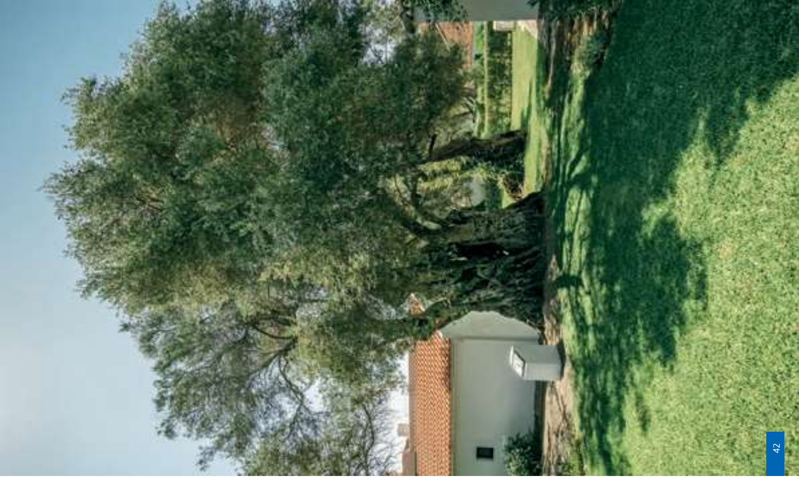
Olivier bimillénaire (page de gauche)