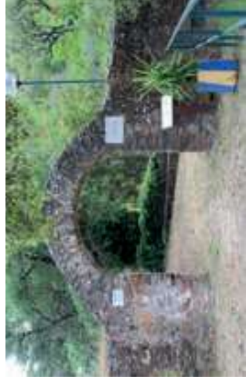
Entrada al parque recreativo de Fonte Férrea