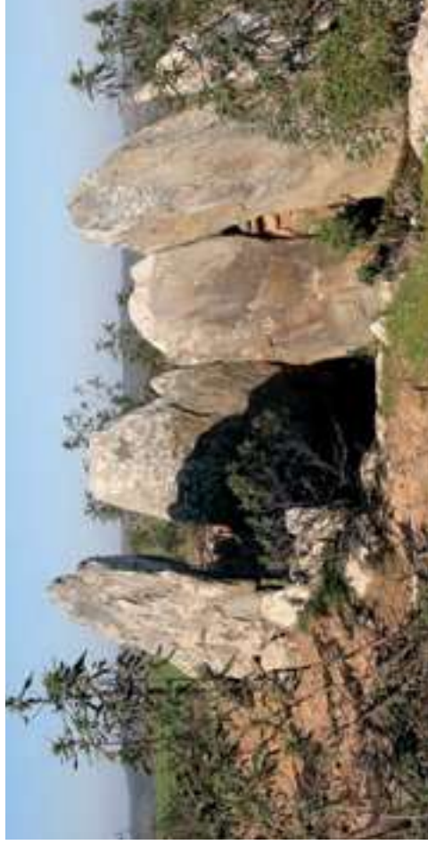
Anta de Masmorra

En la parroquia de Cachopo también podrá disfrutar de varios recorridos para realizar a pie o en bicicleta. Los Centros de Descubrimiento del Mundo Rural (instalados en las antiguas escuelas de primaria) prestan el auxilio necesario a los usuarios.