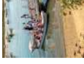
Cais de embarque