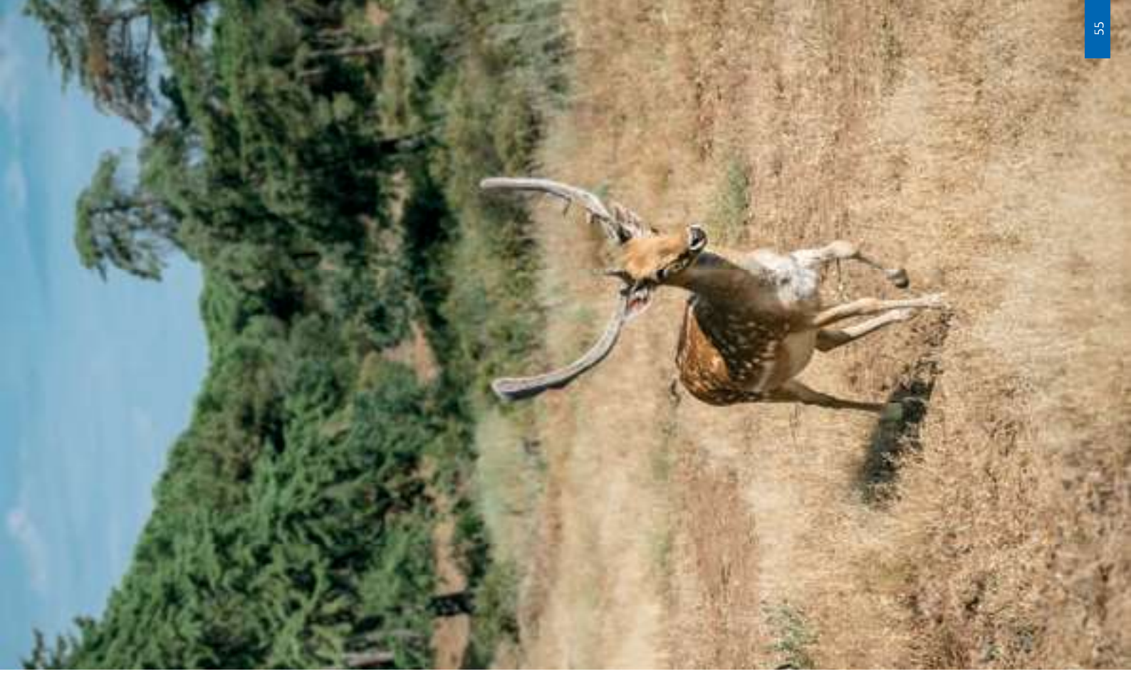
Gamo no Parque de Lazer (à direita)