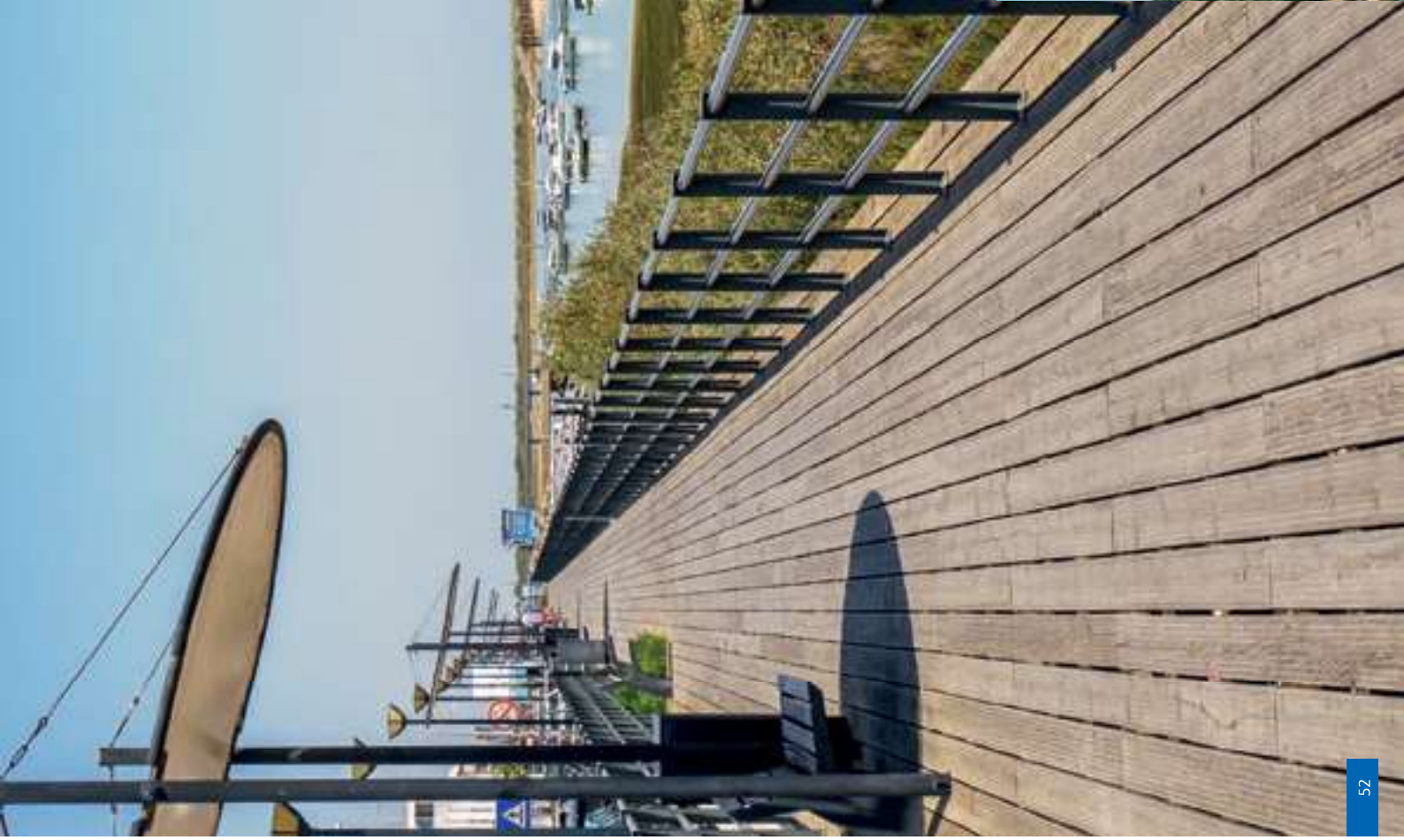
Fortaleza de São João da Barra (em baixo)