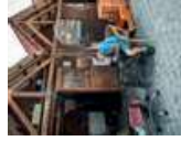
Pescador concentra antes de pesca

Após esta visita, vire, à direita, na Rua Ormerindo