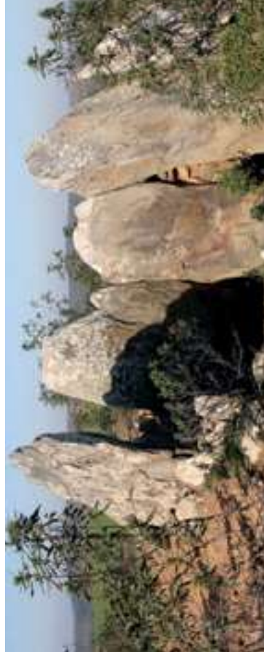
Anta de Masmorra

Maisons circulaires ou paillers (page de droite)