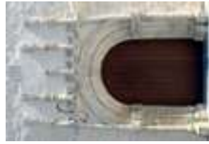
Portada gótica- manuelina del antiguo monasterio de Nossa Senhora da Piedade

Frente a la biblioteca se encuentra la 11 ermita de São Sebastião , un pequeño templo medieval dedicado al culto al mártir considerado el protector contra las epidemias y los contagios. Se reconstruyó y redecoró siguiendo los cánones barrocos en 1745. En la capilla mayor existen pinturas del artista local Diogo de Mangino, que constituyen la más completa recreación pictórica de la vida de san Sebastián dentro del arte portugués. Rodeando la ermita por la derecha, continúa hasta el 12 antiguo monasterio de Nossa Senhora da Piedade (o de las Bernardas).