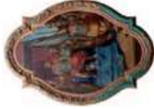
Pintura de la ermita de São Sebastião

Municipal Álvaro de Campos , que ocupa el edificio de la antigua cárcel de Tavira, construido en el siglo XX. Este proyecto del arquitecto João Luís Carrilho da Graça es un ejemplo de cómo se puede combinar el patrimonio histórico con la arquitectura contemporánea para que coexistan en perfecta armonía.