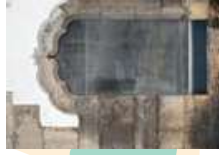
Puerta manuelina de la farmacia Montepio

A la derecha se encuentra en 5 jardín de São Francisco, en donde todavía se puede ver el cementerio de la Orden Tercera de San Francisco de Távira, que sirvió de crematorio público hasta