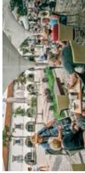
Praça da República

Regrese al punto de partida en Praça da República o aproveche para descansar en alguna de las terrazas que hay en Rua José Pires Padinha o en el Mercado da Ribeira.